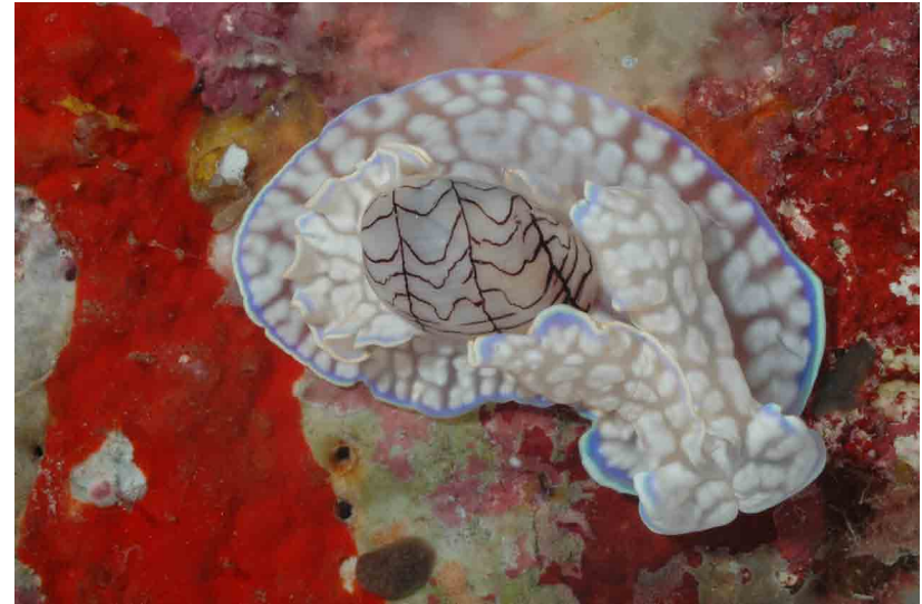
En el mar sorprende la diversidad de formas y colores que puede adoptar la vida. En la foto el gasterópodo Micromelo undata

Para resumir, puede decirse que la mayor estabilidad del medio marino, unida a la ausencia